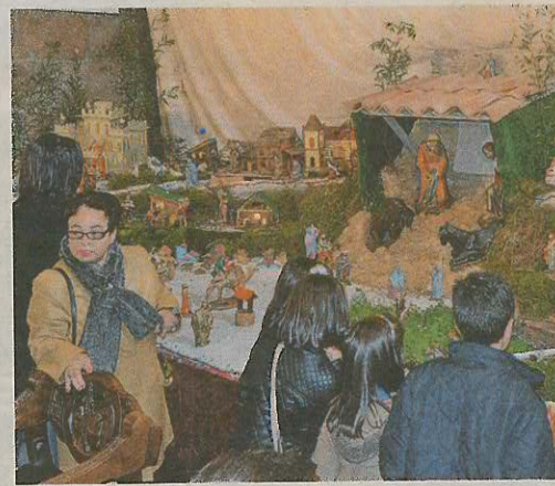
Fisterra. El belén de la iglesia das Areas ya ha atraído a numerosos vecinos.