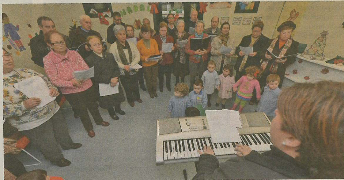
Cee. Los niños de la guardería municipal disfrutaron ayer de una jornada de fiesta, regalos y villancicos acompañados por los usuarios del centro social de la localidad.