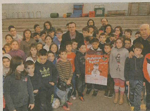
Malpica. El alcalde de Malpica entregó los premios del concurso navideño de pintura y dibujo.

a una oenegé de los alimentos del mercadillo solidario; el CRA Novo Mencer, que acogerá un belén viviente y panxoliñas, y el CRA Os Remuíños, de Cabana . También celebrarán festivales la Escola de Idiomas de Carballo (Pazo da Cultura, 18,00) y la de Música de Cee (salón de actos municipal 19,30).