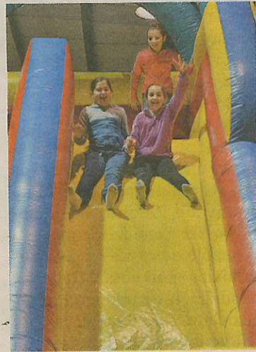
Cee. Diversión con hinchables en el Eugenio López. M. R.