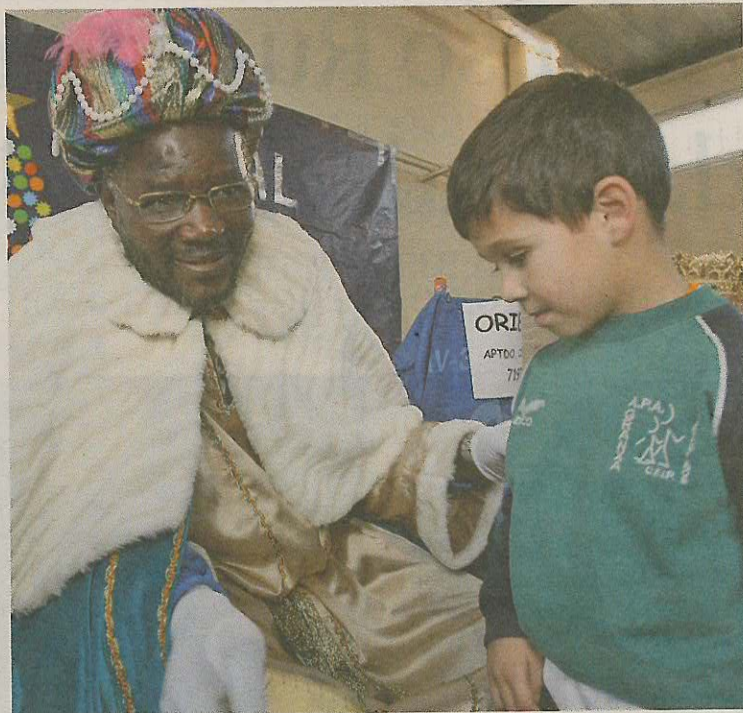
Reyes en el Bergantiños. Los alumnos del colegio Bergantiños recibieron ayer la visita anticipada de los Reyes Magos.